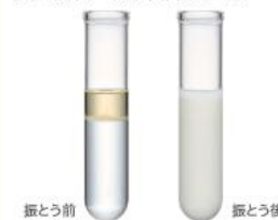
ジース トリートメントオイル レベル1

水80%+オイルトリートメント20%を入れた試験管を手で100回振とう。振とう前はオイルと水が分離した状態ですが、振とう後は乳化し水(W)がオイル(O)の中に閉じ込められたW/Oエマルジョンになっています。これが、髪のうるおいを持續させるバイコンティニューアスエマルジョンです。