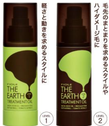
ジース トリートメントオイル