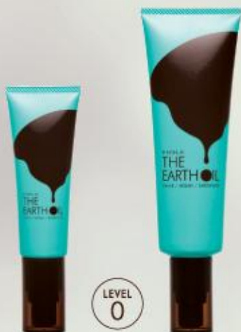
アースオイルエッセンス